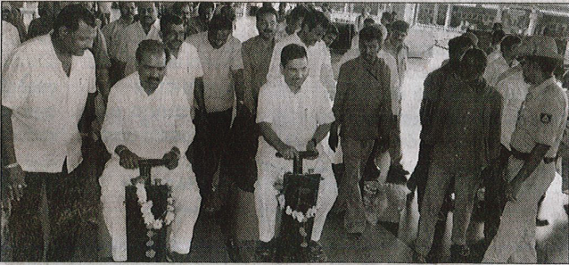
ಹುಬ್ಬಳ್ಳಿ ರೈಲ್ವೆ ನಿಲ್ದಾಣದಲ್ಲಿ ಅತ್ಯಾಧುನಿಕ ಯಂತ್ರೋಪಕರಣಗಳ ಮೂಲಕ ಕೈಗೊಳ್ಳುವ ಸ್ವಚ್ಛತಾ ಕಾರ್ಯಕ್ಕೆ ಸಂಸದ ಪ್ರಹ್ಲಾದ ಜೋಶಿ ಚಾಲನೆ ನೀಡಿದರು.