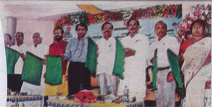
హుబ్బళ్ళి-తోరణగల్లు రైలు మార్గాన్ని ప్రారంభిస్తున్న రైల్వేశాఖ మంత్రి సురేష్ ప్రభు, కేంద్ర మంత్రులు ప్రకాష్ జావడేకర్, సదానందగౌడ, రాష్ట్రమంత్రులు తదితరులు

గల్లు ప్రాంతాల్లో పూర్తి చేసిన రైలు మార్గాన్ని ఆది వారం ఇక్కడ సిటీ రైల్వే స్టేషన్ లో ఏర్పాటు చేసిన కార్యక్రమంలో ప్రారంభించిన సందర్భంగా కేంద్ర మంత్రి సురేష్ ప్రభు మాట్లాడారు. సబర్బన్ కు ఎదురవుతున్న అడ్డంకులకు బెంగళూరు నగరాభి వృద్ధి శాఖ మంత్రి కేజేజార్జి పరిష్కారాలు కను గొంటే పథకాన్ని అమలులోకి మిగతా 3లో ▶