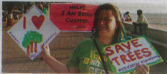
An activist from Save Aarey Foundation for Environment protests against felling over 5,000 trees for the metro 3 project (file photo)

with eight-coach rakes carrying 2,500 passengers each, will cause a 20-30 per cent shift in ridership from the suburban trains and a 10-15 per cent transit from cars, buses and autorickshaws.