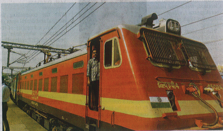
Thankless job: The All-India Loco Running Staff Association says loco pilots work in difficult, often suffocating, conditions. ■ ANIL KUMAR SASTRY

Though a few electric locos are designed to be air-conditioned with proper sealing, the AC units are removed at maintenance sheds, making