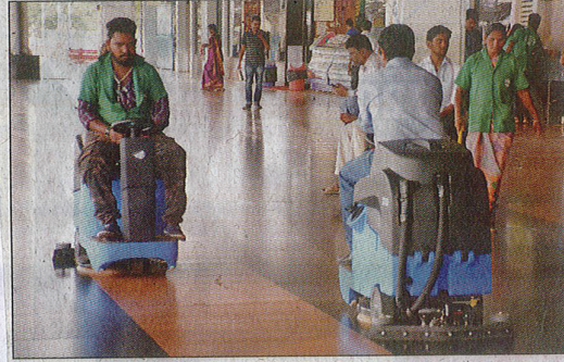
ಹುಬ್ಬಳ್ಳಿ ರೈಲು ನಿಲ್ದಾಣದಲ್ಲಿ ಯಂತ್ರಗಳ ಮೂಲಕ ಸ್ವಚ್ಛತಾ ಕಾರ್ಯ ನಡೆಸಿರುವ ಸಿಬ್ಬಂದಿ.