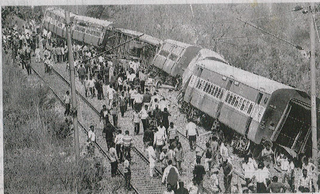
File photo of the coaches of Meerut-Lucknow Rajya Rani Express which derailed near Rura railway station at Rampur in Uttar Pradesh, in April this year

The committee highlighted that the mission was a good effort but the role of industry was very limited and IPR (intellectual property rights) policy of Indian Railways was not conducive for promotion of this academia-industry-railway partnership.