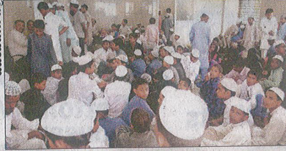
ಬೆಂಗಳೂರಿನ ರೈಲ್ವೆ ನಿಲ್ದಾಣಕ್ಕೆ ಬಂದ ಮಕ್ಕಳು.

ಗುವಾಹಟಿ-ಬೆಂಗಳೂರು ಎಕ್ಸ್ ಪ್ರೆಸ್ ರೈಲಿನಲ್ಲಿ ಆಗಮಿಸಿದ್ದ 208 ಮಕ್ಕಳು ಕಂಟೋನ್ಮೆಂಟ್ ಹಾಗೂ ಕೆ.ಆರ್.ಪುರ ರೈಲು ನಿಲ್ದಾಣಗಳಲ್ಲಿ ಇಳಿದುಕೊಂಡರು. ಈ ವೇಳೆ ಸ್ಥಳದಲ್ಲಿ ಪೊಲೀಸರು ಎಲ್ಲ ಮಕ್ಕಳನ್ನು ವಶಕ್ಕೆ ಪಡೆದು ವಿಚಾರಣೆ ನಡೆಸಿದಾಗ ದೇಶದ ಬೇರೆಬೇರೆ ರಾಜ್ಯಗಳಿಂದ ಮದರಸಾಗಳಲ್ಲಿ ಶಿಕ್ಷಣ ಪಡೆಯಲು ಇಲ್ಲಿಗೆ ಬಂದಿರುವ ವಿಷಯ ಗೊತ್ತಾಗಿದೆ. ಫುಟ 4