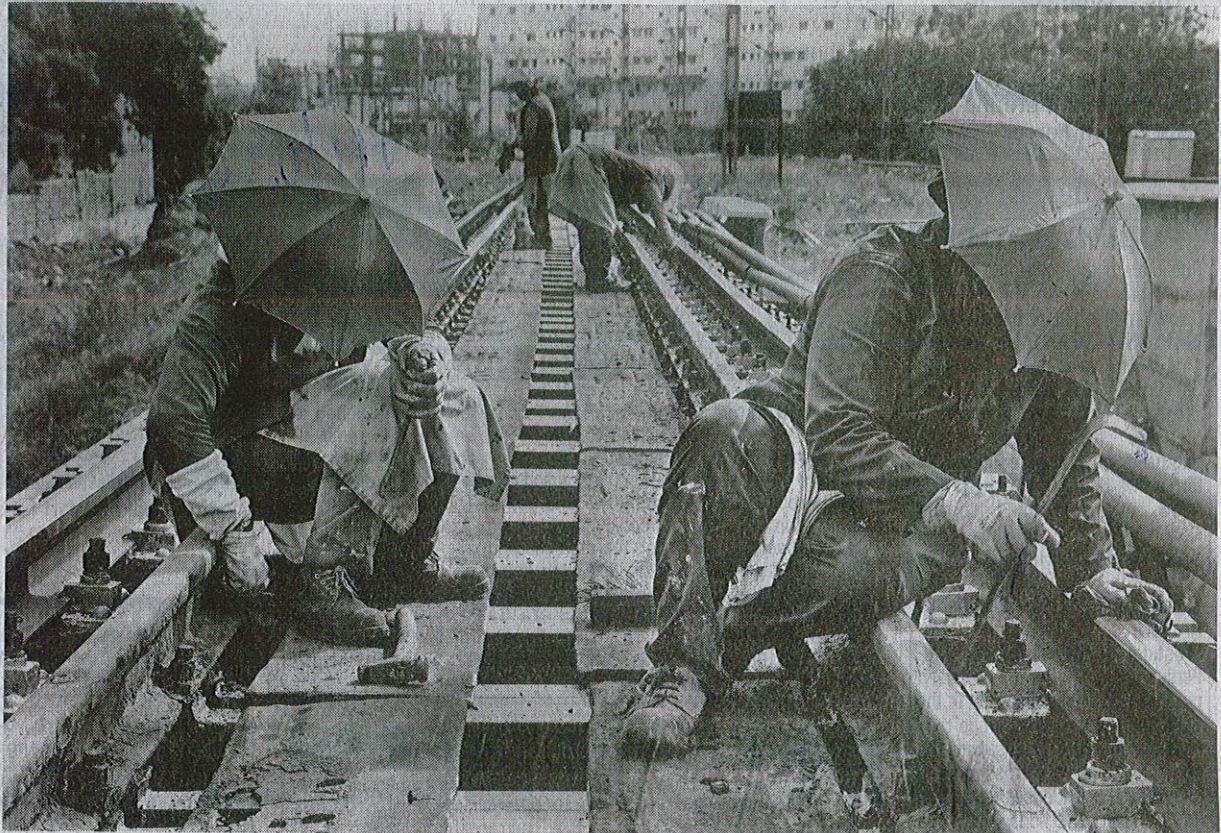
Hard at work: Railway workers protecting themselves from the hot sun while on duty in Coimbatore on Monday.