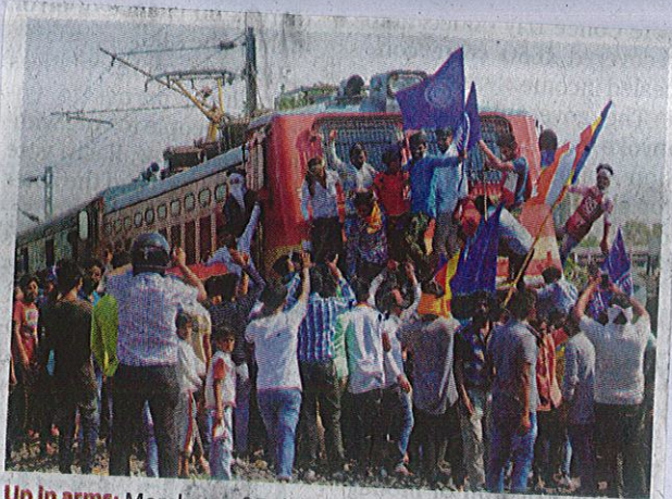
Up in arms: Members of Dalit organisations blocking a train in Nagpur on Monday.

दि हिन्दु/मंगलूर THE HINDU/MANGALORE 03 APR 2018