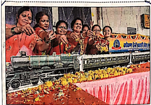
Railway employees and commuters commemorate the 166th year of Indian Railways, in Thane, on Tuesday. On April 16, 1853, the first passenger train of Indian Railways ran between Bori Bunder (Mumbai CSMT) and Thane.