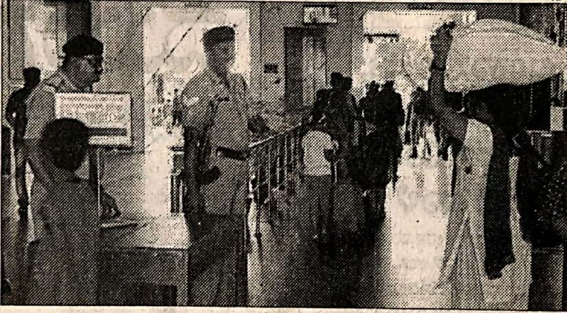
ರೈಲ್ವೆ ನಿಲ್ದಾಣದಲ್ಲಿ ಪ್ಲಾಟ್‌ಫಾರಂ ಪ್ರವೇಶಿಸುತ್ತಿರುವವರನ್ನು ಪರಿಶೀಲಿಸುತ್ತಿರುವ ಆರ್‌ಪಿಎಫ್.