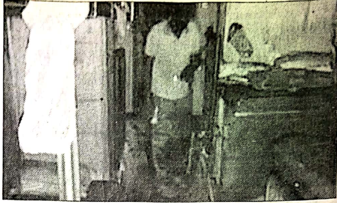
ಬೆಂಕಿ ಅವಘಡದಲ್ಲಿ ಸುಟ್ಟು ಹೋದ ವಸ್ತುಗಳು.

ಅಗ್ನಿಶಾಮಕ ದಳಕ್ಕೆ ಮಾಹಿತಿ ರವಾನಿಸಿದ್ದರೂ ಅವರು ಬರುವುದರೊಳಗೆ ಸ್ಥಳೀಯರೇ ಬೆಂಕಿ ನಂದಿಸುವಲ್ಲಿ ಯಶಸ್ವಿಯಾದರು. ಎಸಿ ಗ್ಲಾಸ್