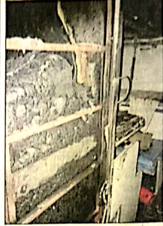
A fire broke out in an AC bogie of Mangala Express (Train No. 12618 - H Nizamuddin to Ernakulam Junction) near Bijoor in Udupi district in the wee hours of Sunday.

was kept ready at the station in case of any emergency. The officials from Goa, Mangaluru and Udupi visited the spot.