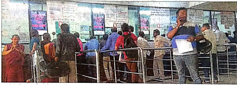
ಹುಬ್ಬಳ್ಳಿ: ನಗರದ ರೈಲ್ವೆ ನಿಲ್ದಾಣದ ಅರಕ್ಕಣ (ಮುಂಗಡ) ಟಿಕೆಟ್ ಕಾಯ್ದುಕೊಳ್ಳುವ ಕೇಂದ್ರ.

ಹುಬ್ಬಳ್ಳಿ ನಿಲ್ದಾಣವು ದೇಶದ ಪ್ರಮುಖ ನಗರ, ಪ್ರವಾಸಿ ತಾಣಗಳಿಗೆ ಸಂಪರ್ಕ ಕಲ್ಪಿಸುವ ಮುಖ್ಯ ಆಂಕ್ಷನ್ ಆಗಿದೆ. ಇಲ್ಲಿಂದ ಬೆಂಗಳೂರು, ಮೈಸೂರು, ಮುಂಬಯಿ, ದೆಹಲಿ, ಜೋಧಪುರ, ಗೋವಾ, ಹೈದರಾಬಾದ್, ತಿರುಪತಿ ಸೇರಿದಂತೆ ದೇಶದ ವಿವಿಧ